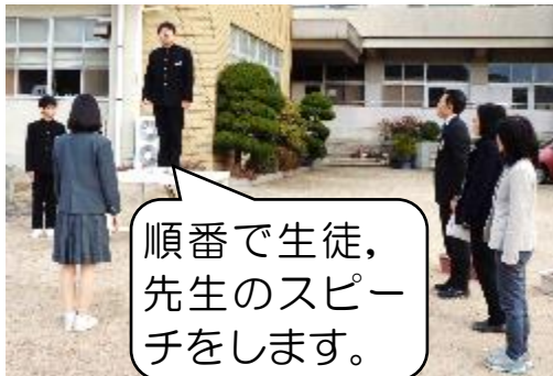
順番で生徒、先生のスピーチをします。