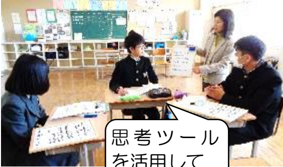
思考ツール を活用して