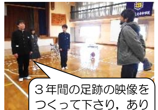
3年間の足跡の映像をつかって下さり、ありがとうございます。