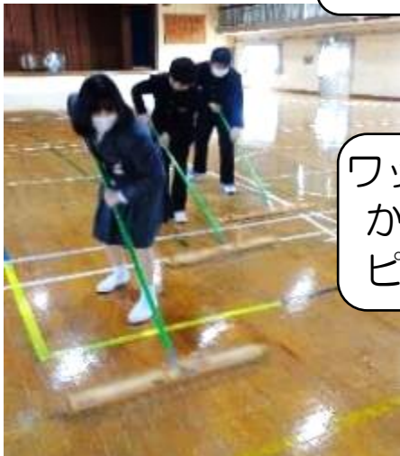
ワックスをかけてピカピカに！