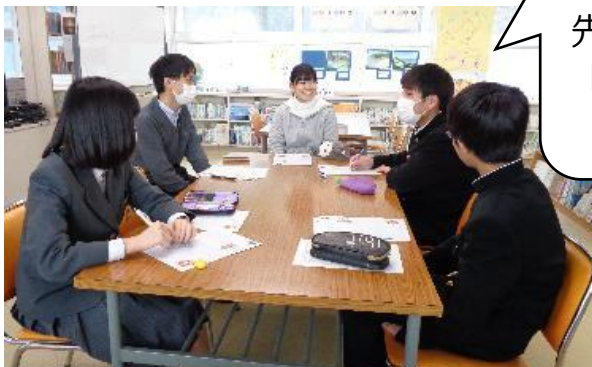
スクールカウンセラーの先生による「怒りのコントロール」