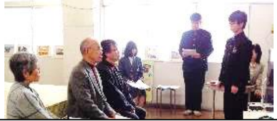
総合学習や学校の様子を発表。自分の考えを堂々と発表し、地域の方へ感謝も伝えることができ、感心したとのこと。