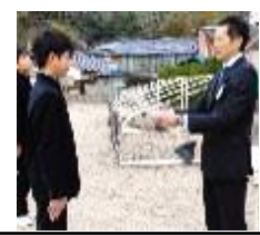
笠岡市児童生徒美術展にて3人とも「入選」に入賞。おめでとう！