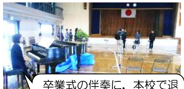
卒業式の伴奏に、本校で退職された先生が、かけつけて下さいました。練習も。