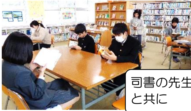
司書の先生と共に