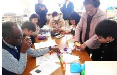
流し雛に参加予定