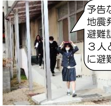
予告なしで、地震発生時の避難訓練。3人とも真剣に避難！