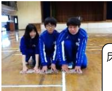
床を少しずつ3人で協力して雑巾がけ！